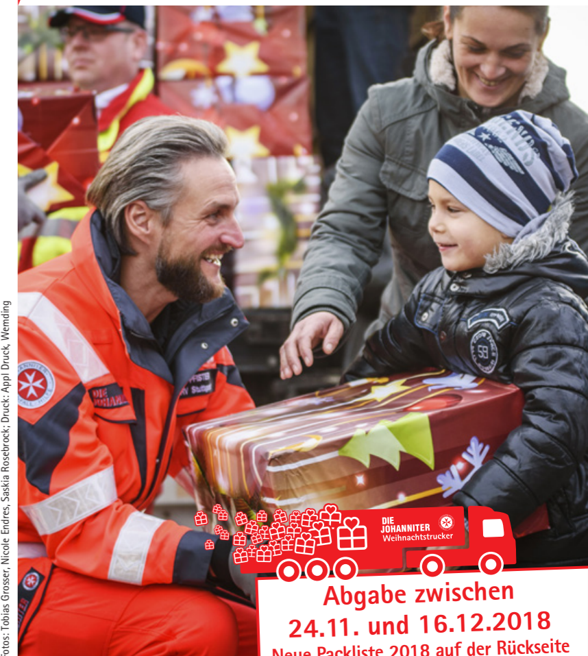
Fotos: Tobias Groszer, Nicole Endres, Saskia Rosebrock; Druck: Appli Druck, Wemding

Abgabe zwischen 24.11. und 16.12.2018 Neue Packliste 2018 auf der Rückseite